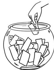
Tirer au sort