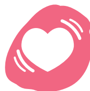
Coeur qui bat vite