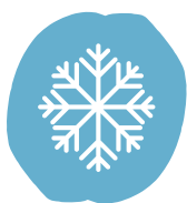
Sensation de froid

Encerle chacune des sensations physiques que ton corps pourrait t'envoyer dans cette situation.